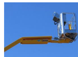
Fly jib (option)